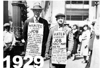
Imagen 3. Crisis del 29.

El capitalismo no es infalible, teniendo en cuenta que siempre se busca aumentar la ganancia hay momentos en que las riquezas no pueden seguir creciendo y se llega a la situación de crisis económica. Como al final de la IGM parecía que todo iba muy bien para Estados Unidos, puesto que vendía sus mercancías al resto del mundo y recibía intereses por los préstamos de dinero, se llegó a la creencia exagerada de que la riqueza podía ser ilimitada. En la bolsa de valores, los inversionistas no se preocupaban por el dinero real si no que realizaban transacciones basadas en acciones y bonos, de manera que cuando se intentó responder por todos los compromisos del país no había realmente dinero suficiente que sirviera como base para las transacciones. Los inversionistas entraron en pánico y reclamaron su dinero, como no se pudo devolver, se llegó a una crisis que tuvo repercusiones a nivel mundial, por ser Estados Unidos la nueva potencia capitalista. Ese país tuvo que iniciar con la realidad de su economía enfrentando desempleo, paralización de las industrias y en general una grave situación económica de la que fueron saliendo poco a poco.