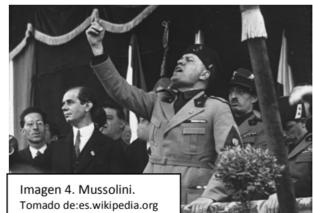
Imagen 4. Mussolini.

Nacionalismo. Es una ideología política que considera que la democracia, el capitalismo y el socialismo son un fracaso. Proponen que la sociedad se organice en torno a un líder con carisma, que sea fuerte y que logre traer el orden, de manera que se respete la autoridad. Defienden los valores nacionales inclusive con la violencia. Italia es el primer país en el que va a existir un gobierno dictatorial basado en esta ideología, con Mussolini (1922 a 1943) y su ejército paramilitar