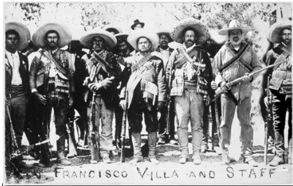
Imagen 1. Tropas de Pancho Villa.

Revolución mexicana (1910-1928). México era un país con una presencia importante en América y con antecedentes de corrupción y grandes diferencias entre ricos y pobres en la dictadura de Porfirio Díaz, conocida como el porfiriato, que sucedió entre 1876 a 1910. Los políticos de la oposición manifestaban su desacuerdo en frente al porfiriato en cabeza de Carranza, los campesinos del norte reclamaban tierras, dirigidos por el famoso Pancho Villa, y los indígenas con su líder Emiliano Zapata pedían reconocimiento y derecho a la tierra.