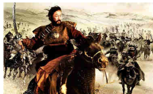
Imagen 5. Gengis Khan y su ejército

El Imperio Mongol fue el imperio más extenso de la historia, ocupando casi toda Asia y parte de Europa, unos 36 millones de km 2 . Esta conquista se realizó debido a la unión de las tribus mongolas bajo un solo hombre y al importante sistema de estrategia militar basado en el uso de la caballería, que permitía que el desplazamiento por el imperio fuese más rápido. El Imperio fue creado por Gengis Khan, que traduce el gran Khan, en el siglo XIII. Ya con el poder en sus manos, comenzó la invasión de los Xi Xia de china y del imperio Jin. Pero tras haber conquistado una gran cantidad de territorios murió durante la campaña contra los Xi Xia. Su sucesor, el segundo Khan, continuó ampliando al Imperio con la conquista de Persia y la destrucción final de los Xi Xia. Más tarde entró en guerra con la dinastía Song y acabó conquistando toda China, tras lo cual invadió Rusia (que entonces era mucho más pequeña) y la redujo al vasallaje.