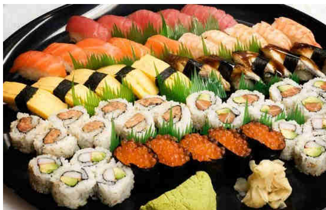
Imagen 9. Sushi: comida típica japonesa