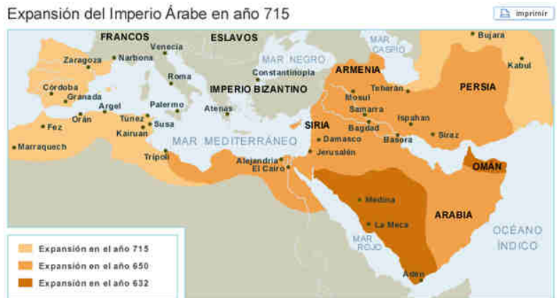
Imagen 1. Mapa del Imperio Islámico

El imperio islámico surgió en el siglo VII en la península Arábiga. Nació de la unión del Imperio de los Sasánidas en Persia y del Imperio Bizantino, ocupando las provincias bizantinas de Asia y del Norte de África (Siria y Egipto). Su extensión llegó a la península Ibérica, la isla de Sicilia y otras tierras europeas. No obstante, la expansión de su cultura llegó a la India, China, Etiopía, Sudán Occidental, Sur de la Galia y Constantinopla, proyectando su influencia más allá de sus límites territoriales.