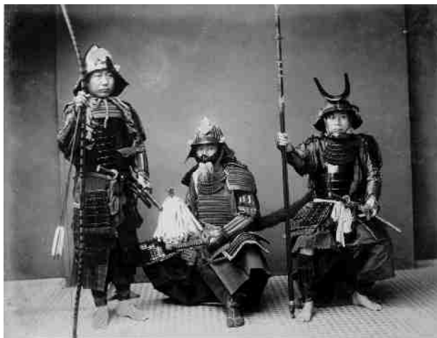
Imagen 7. Foto real de Samuráis

En Japón durante la Edad Media, se vivió una situación similar a la de Europa en lo relacionado a la política y a la organización social, pero por supuesto con sus características particulares en relación con su cultura propia. Existieron familias nobles, y una organización basada en lo militar a cargo de los Shogunes o conocida como Shogunato. La palabra japonesa “shogún” quiere decir, literalmente, “comandante en jefe para la destrucción de los bárbaros”. En la práctica era la denominación que tenían los dictadores militares que imperaban en el Japón medieval. Las invasiones extranjeras acabaron uniendo a los nipones (japoneses) en torno a la figura del shogún y de sus guerreros, los samuráis. Éstos habían sido mercenarios que, a partir de 1224, gozaron de un estatuto legal propio después de haber demostrado ampliamente su arrojo militar en el enfrentamiento contra los mongoles de Kublai Khan, a quien consiguieron rechazar a pesar de su diferencia numérica. La gloria obtenida por los samuráis sería aprovechada por los shogunes para ir conquistando cada vez más cotas de poder frente a los aristócratas de la corte. Y hasta tal punto lo consiguieron que su autoridad llegó a igualar e incluso superar a la del emperador. Japón aún continuaba en esta situación medieval a mediados del siglo XIX, cuando el emperador Miji lanzó la revolución que llevaba su nombre, basada en una serie de reformas para modernizar el país.