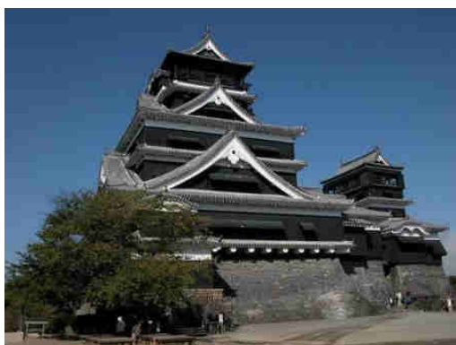
Imagen 8. Arquitectura japonesa

Existieron tres periodos de Shogunato, el shogunato o era Kamakura (1185 a 1333), el shogunato Ashikaga o era Muromachi (1336 a 1573) y el shogunato Tokugawa o era Edo (1600 a 1868). La civilización japonesa aporta al mundo su cultura, lenguaje, alfabeto, costumbres, música, danzas, arquitectura, religión del Shinto y una tradición basada en la disciplina.