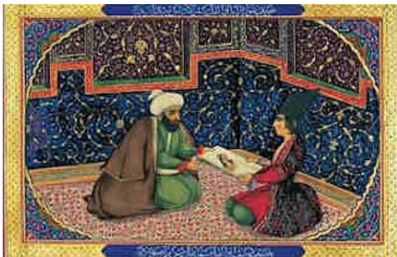
Imagen 2. Ilustración de las Mil y una noches

La cultura árabe se centraba en la vida de pastores nómadas, los cuales no conformaron un Estado. La unión de esta sociedad se fundaba en comunidades que se dividían en familias. El jefe de familia (patriarca) fue