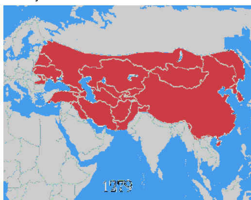
Imagen 6. Mapa del Imperio Mongol

Pero cuando los mongoles iban a conquistar Europa, que habría significado su dominio total del mundo, el Khan murió y tuvieron que volver a Mongolia para elegir al nuevo Khan. Aun así, antes de volverse a Mongolia, les dio tiempo de devastar Croacia, Bulgaria, Polonia, Lituania y Hungría. Con el siguiente Khan, los mongoles llegaron hasta Siria y Palestina, pero a su muerte tuvieron que paralizar de nuevo la conquista. Los próximos Khanes apenas tuvieron efecto sobre la frontera del Imperio y definitivamente, bajo el reinado de Kublai Khan, el Imperio se dividió en varios reinos que marcaron el fin del Imperio.