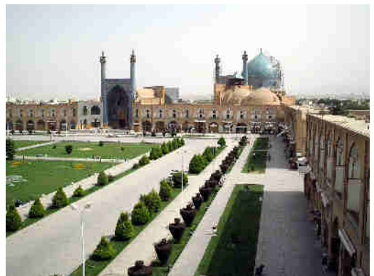
Imagen 3. Mezquita en Irán

La cultura árabe se centraba en la vida de pastores nómadas, los cuales no conformaron un Estado. La unión de esta sociedad se fundaba en comunidades que se dividían en familias. El jefe de familia (patriarca) fue